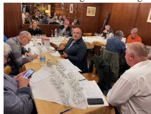
Préparation du concours de dégustation à Sarreguemines avec MVT

Les Babures de Frémeréville, le syndicat de distillation ainsi que la commune sont bien sûr de la partie et les détails de cette animation sont encore en réflexion. La fédération des bouilleurs de cru de Moselle organise déjà ce type de dégustation en mode privé. Nous nous appuyons donc sur leur expérience en ce domaine.