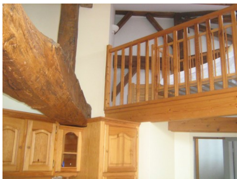
Des gîtes campagnards tout confort